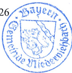
Birkner 1. Bürgermeister

Ortsüblich bekannt gemacht durch Anschlag an der Amtstafel am 08.04.2026 Abgenommen am