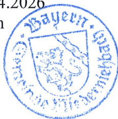
Birkner 1. Bürgermeister

Ortsüblich bekannt gemacht durch Anschlag an der Amtstafel am 08.04.2026 Abgenommen am